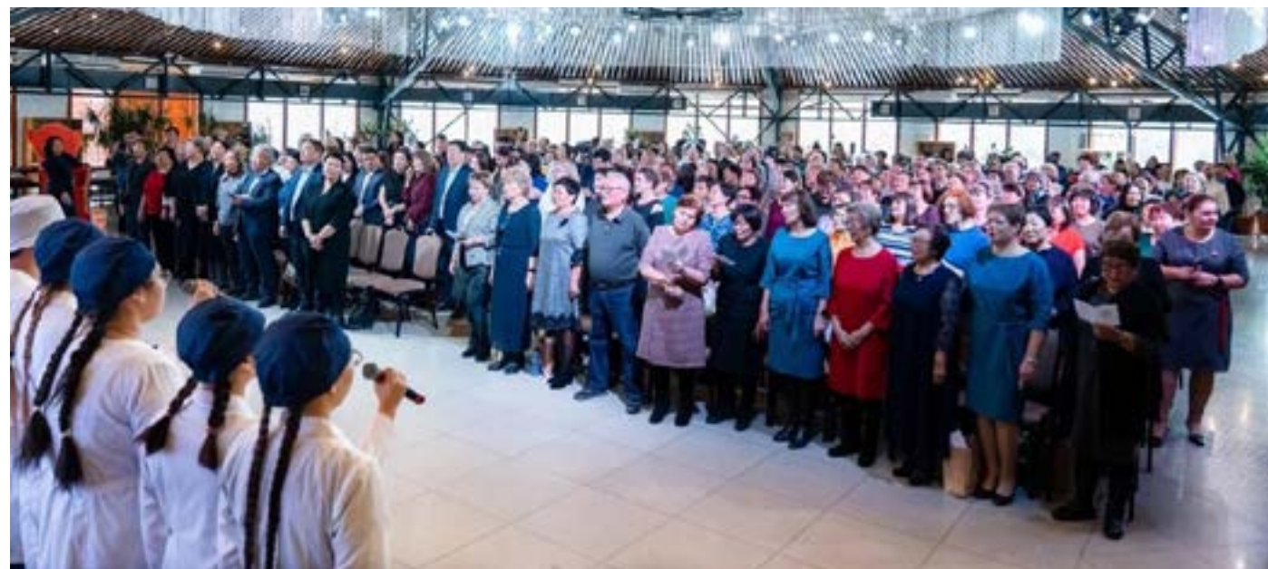
На I Республиканском форуме педиатров