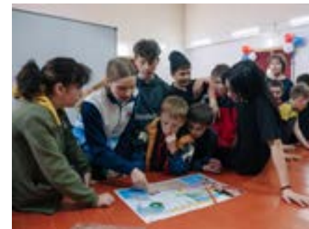
«Тур общественного здоровья» в Бичурском районе

И, конечно, каждый Тур завершается межведомственным «круглым столом» в администрации муниципалитета.