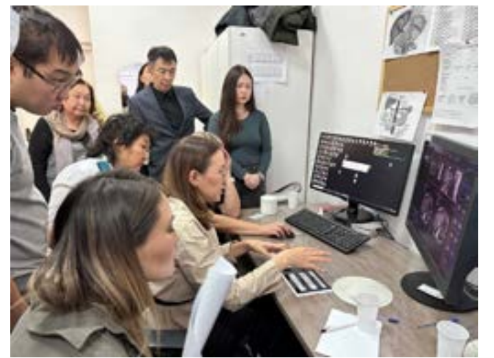
Во время конференции «Актуальные вопросы лучевой диагностики»

Благодаря этому направлению лекарственной терапии на сегодняшний день перед клиницистами открываются широкие возможности лечения пациентов с трудноконтролируемой бронхиальной астмой, тяжелыми наследственными нарушениями липидного обмена, рев-