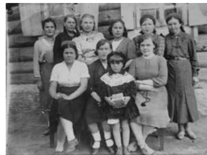
Сандружинницы, 1943 год, Улан-Удэ.

Когда девочки ушли на фронт, меня взяли инструктором райкома Красного креста. Председателем обкома Красного креста была Вален-